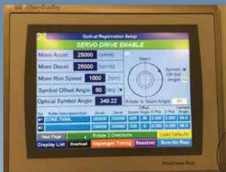
易于控制的接缝线角度位置和 玻璃瓶印花位置操作界面