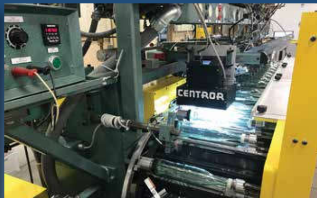
STRUTZ CLS-200 / DECOSYSTEM CENTROR